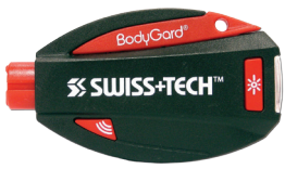
ESC 5 w 1